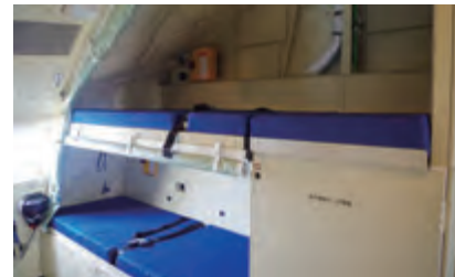
コックピット後ろの簡易ベッド、長距離輸送が前提