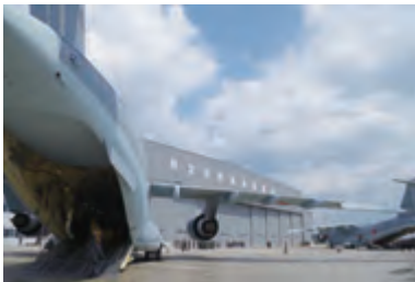
1月に完成した格納庫 C-2専用格納庫