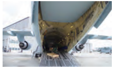
隊員と荷物と比べてこの機体の大きさ！