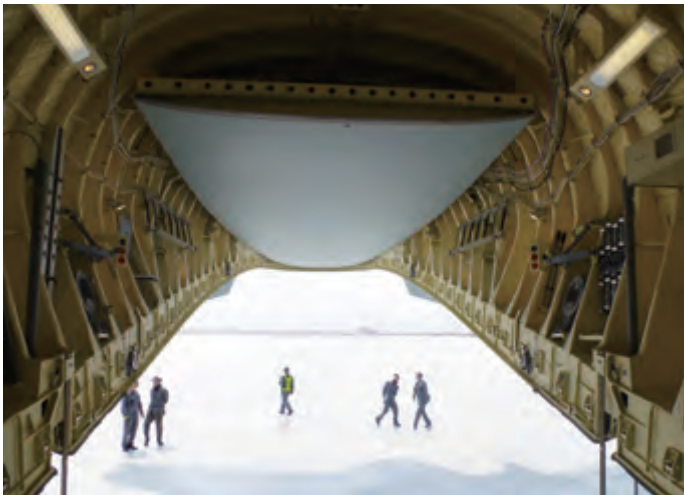
機内は新品の臭いがした