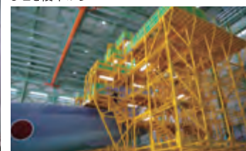
尾翼を整備するための器材