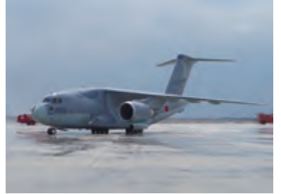
美保基地に初配備された203号機