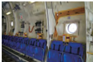
シートは少し傾斜がついていて眠りやすそう(?)