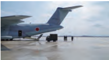
C-2の貨物扉が着地する瞬間