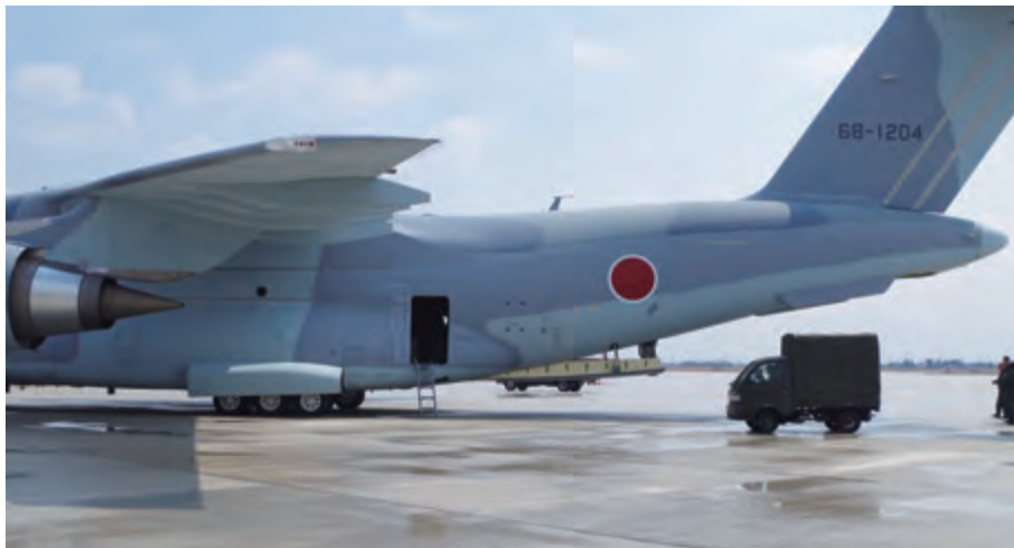
C-2の後ろの貨物扉が美保基地で初めて開く瞬間