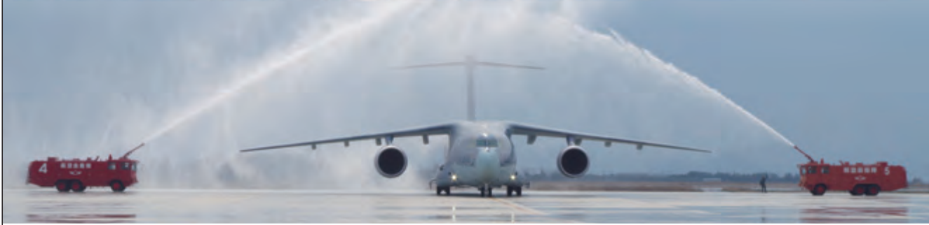
歓迎の放水アーチ