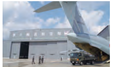
初荷！？岐阜から積んで来た貨物を降ろす