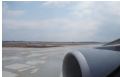
簡易ベッド脇の窓からはこんな見え方