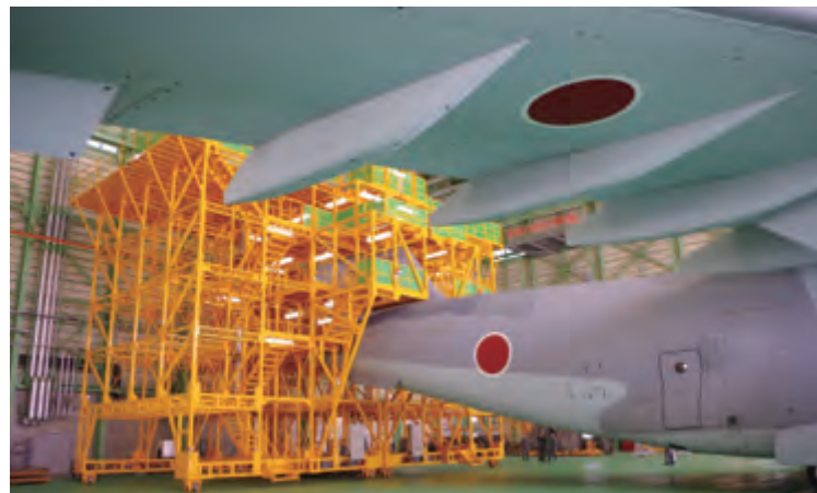
全長43.9m 全幅44.4m 全高14.2mのC-2輸送機