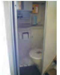
トイレもコンパクトに収まっている