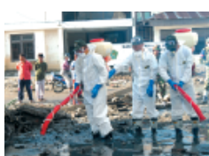
インドネシア国警察