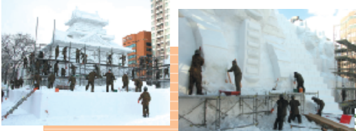
さっぽろ雪まつりに自衛隊の力は欠かせない