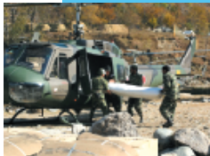
パキスタン国警察