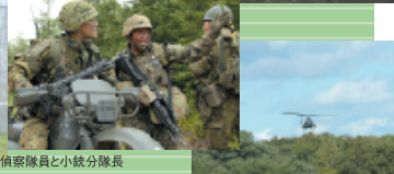
偵察隊員と小銃分隊長