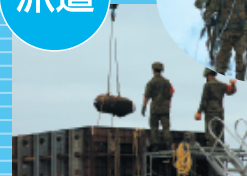
十勝長雪崩災害派遣