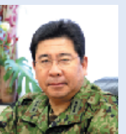
北部方面總監 陸将 酒井健

北部方面總監の酒井陸将です。平成20年8月1日付で第31代の北部方面總監として着任しました。私の統率方針は、「いかなる任務にも即応できる強靱な北部方面隊の育成」であります。 北部方面隊は、他国と国境を接する第1師団の方面隊であり、この地域に力のかぎを生じさせてはならず、この地域が安定していればこそ、日本の安